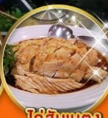
ไก่สับเบตง