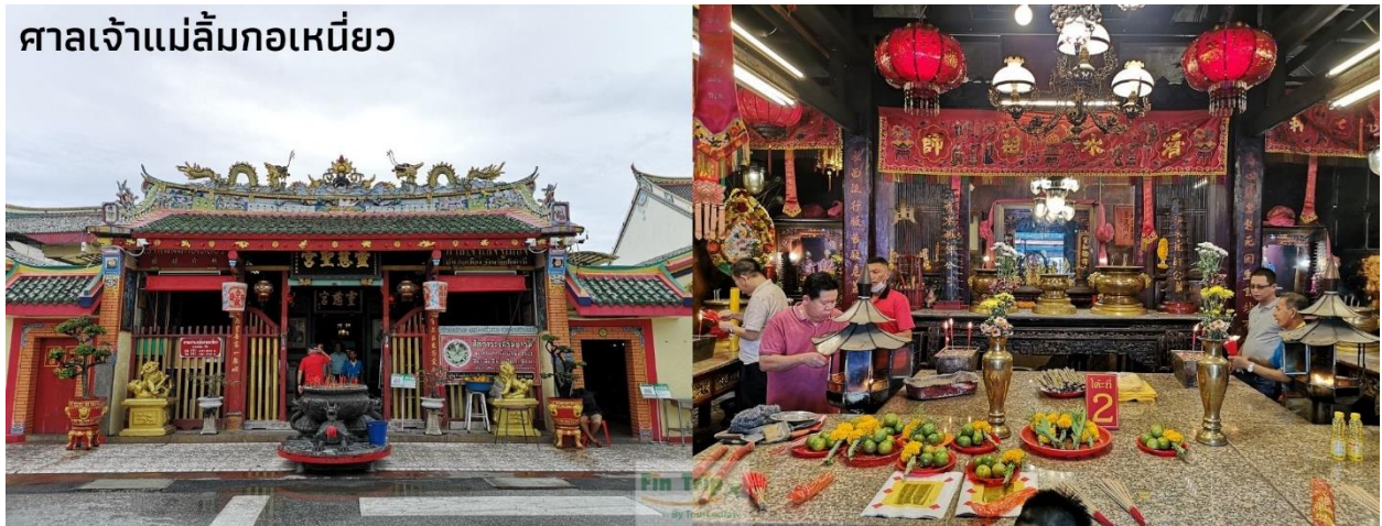
ศาลเจ้าแม่ลิ้มกอเหนี่ยว

จากนั้นนำท่านชม บ้านขุนพิทักษ์รายา สร้างขึ้นมาประมาณปี พ.ศ. 2460 อายุกว่า 100 ปี บ้านขุนพิทักษ์รายาเป็นเรือนแถว 2 ชั้น 2 คูหา 2 ช่วงเสา รูปแบบของตึกแถวมีการประยุกต์ระหว่างสถาปัตยกรรมในท้องถิ่นและสถาปัตยกรรมจีน ซึ่งมีความสำคัญทางประวัติศาสตร์การตั้งถิ่นฐานของชาวไทยเชื้อสายจีนในพื้นที่จังหวัดปัตตานีและเป็นภาพสะท้อนความเจริญรุ่งเรืองของย่านนี้ อีกทั้งยังมีการบันทึกกล่าวถึงตำแหน่งของบ้านขุนพิทักษ์รายาในสมัยรัชกาลที่ 5 เสด็จประพาส