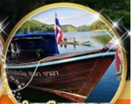
ล่องเรือทะเลสาบ ฮาลาบาลา

สตรีทอาร์ตเบตง, ตูโปรขณีย์โบราณ, สนามบินเบตง ป้ายใต้สุดสยาม อุโมงค์ปิยะมิตร ถ่ายรูปสุดเท่กับต้นไม้พันปี เจ้าแม่ลิ้มกอเหนี่ยว ต้นไม้พันปี หมีนุปลา แซ่ก้าบ่อน้ำพุร้อนเบตง สวนหมีนุปลา, แซ่ก้าบ่อน้ำพุร้อนเบตง, พาชิมเดากวียเบตง ลิ้มรส ไก่เบตง เคาหยก จิ้มจุ่มปลาไหลสายน้ำไหล